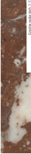
Grotte polie (éch. 1:1)

Marbre d'âge stratigraphique frasien (Dévonien)