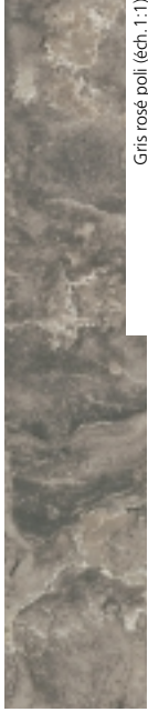
Gris rosé poli (éch. 1:1)